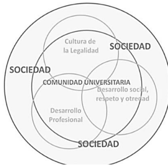
Figura 5 Incorporación de ejes transversales