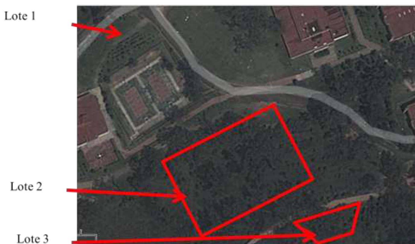
Figura 13 Ubicación de los lotes con árboles susceptibles de ser aprovechados

Se cuentan los árboles ubicados en cada una de las áreas y se mide el volumen del follaje. También se determina la densidad del mismo, con la finalidad de calcular la cantidad de materia prima disponible para la elaboración de la tintura. En la tabla siguiente se muestran los resultados.