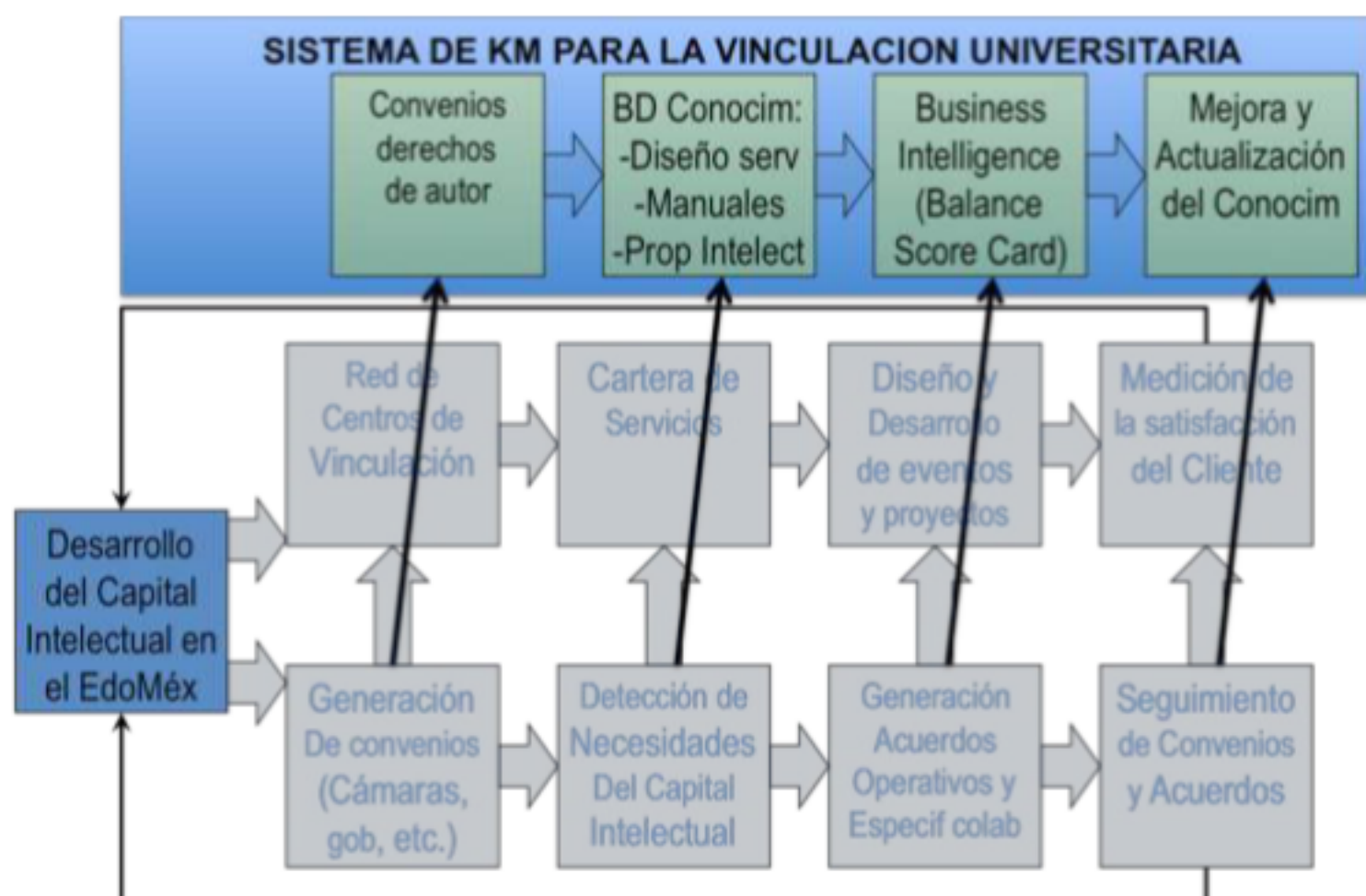
Figura 8.1 KM en el modelo de Extensión (Desarrollo de los autores)

Este modelo permitirá que todo el conocimiento generado por instructores, asesores y grupos de proyectos pueda ser gestionado y permita que cada vez se tenga un acervo mayor de servicios, experiencias de asesoramiento y de proyectos específicos, para este fin se puede aplicar TIC's que permitan esto.