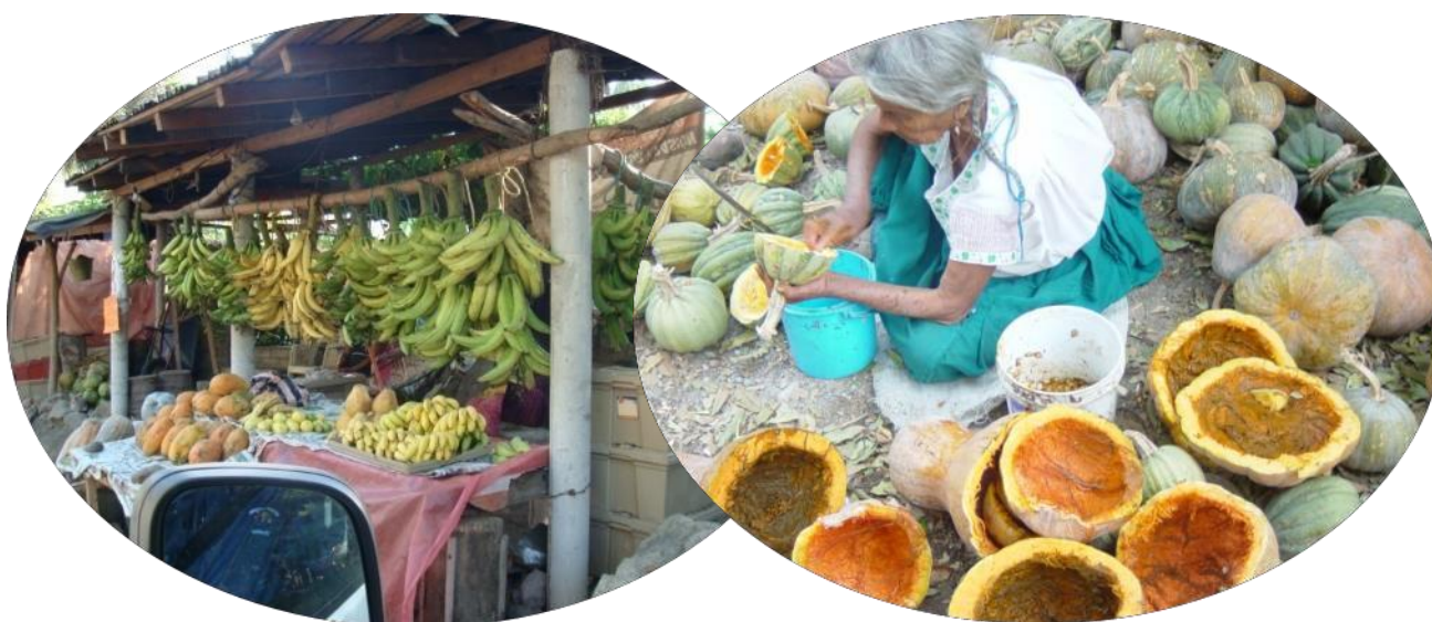
Figura 13 Aprovechamiento de los recursos naturales en la Economía Campesina de la Región Sierra Sur de Oaxaca

La economía campesina, se orienta en lo inmediato a procurarse, a través del aprovechamiento de los recursos naturales, a la obtención de los satisfactores necesarios para su sustento; y en lo mediato la economía campesina aspira a reproducir sus procesos productivos, regenerando esos procesos de trabajo donde se dan vínculos de producción específicos y que se sostiene en determinadas condiciones precarias. Se aspira, lograr su reproducción como pequeños productores.