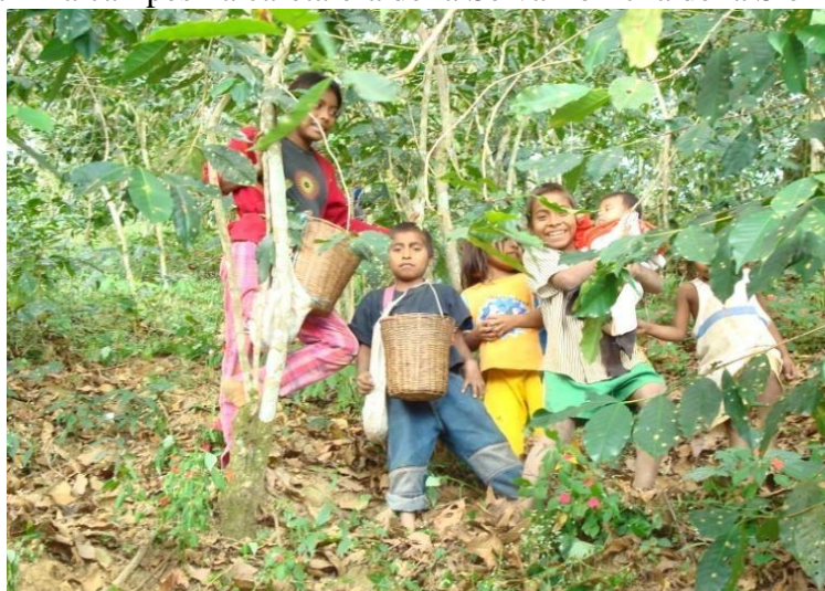
Figura 13.1 Familia campesina cafetalera de la Selva Loxicha de la Sierra Sur de Oaxaca

En este sentido, Marx (1974) plantea lo siguiente:..[Tal como ocurren las cosas, una parte considerable del producto agrícola viene a ser consumido directamente por sus productores, los campesinos, como medio directo de subsistencia, destinándose solamente el resto a servir de mercancía en el comercio con la ciudad. Cualquiera que sea el modo como se halle regulado aquí el precio medio del mercado de los productos agrícolas, es indudable que en estas condiciones deberá existir, lo mismo que bajo el régimen capitalista de producción, la renta diferencial, o sea, un remanente del precio de las mercancías en las tierras mejores o mejor situadas]