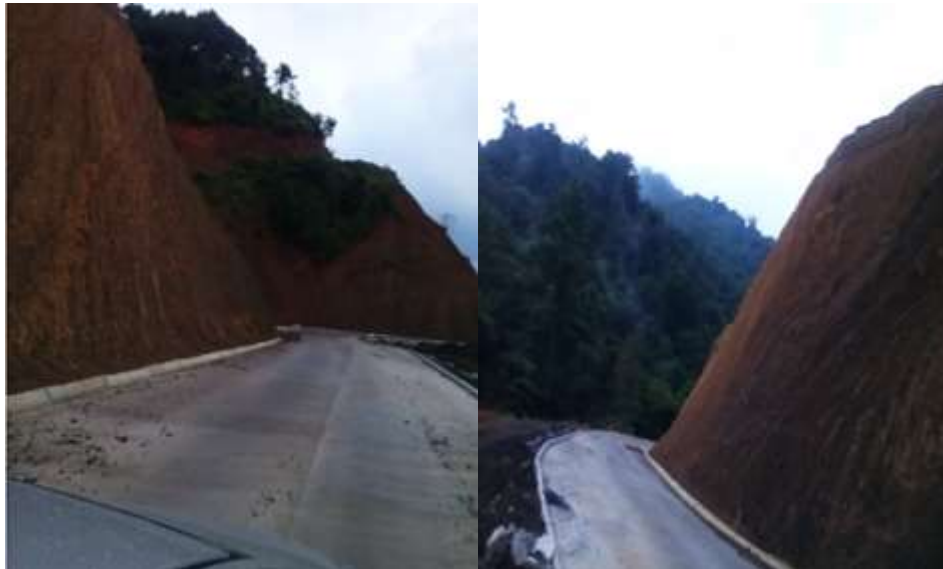
Figura 2.4 Carretera de acceso principal Tuzancoac

Tuzancoac es un pequeño poblado que cuenta ya con los servicios de; Carretera para llegar al poblado en construcción con avance paulatinos (ver Figura 2.4), electricidad, drenaje, agua, dispensario médico, secundaria, auditorio de actividades, iglesia principal, diez tiendas con variedad de productos, internet, señal de celular (en algunos puntos únicamente), primaria, telesecundaria, transporte que sale en horarios específicos,