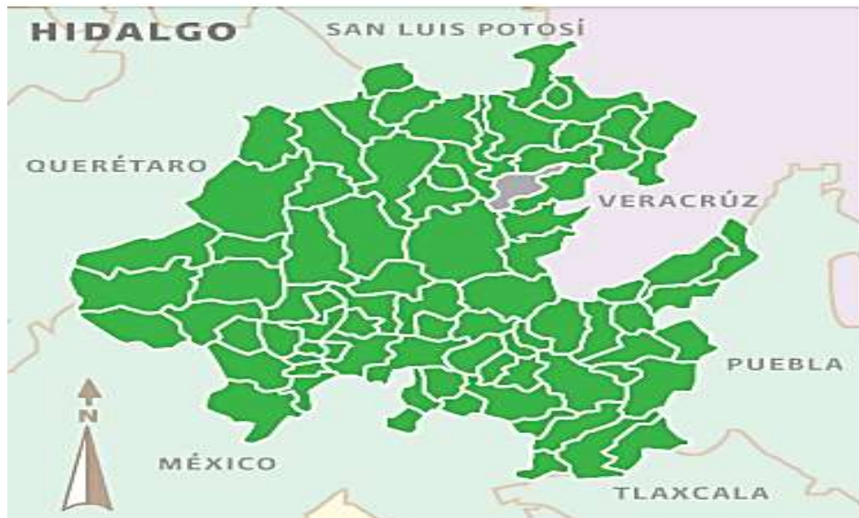
Figura 2 Mapa de ubicación municipio de Xochicoatlán