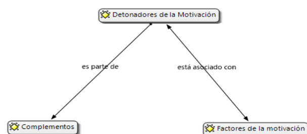
Figura 1 Red Axial de los detonadores de la motivación en el salón de clase

Los jóvenes al experimentar un ambiente donde se les reconoce se sienten animados, con un grado de confianza que les permite desarrollar con libertad y compañerismo la ejecución de las actividades escolares y con deseos de lograr las expectativas de vida que poseen; destacando como fuente principal de la motivación a los padres de éstos.