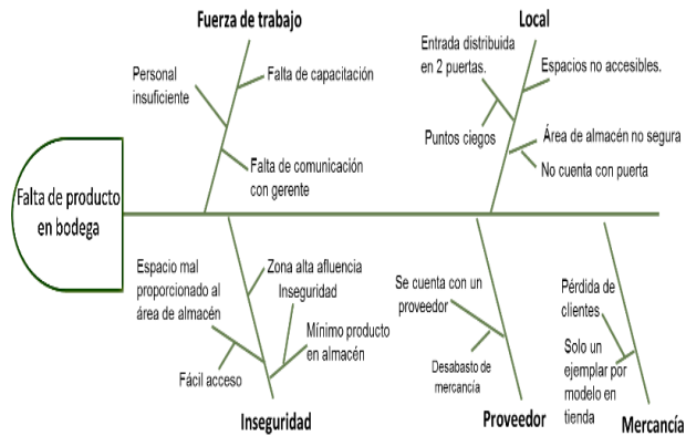
Figura 5 Ishikawa área de compras

Mystery Chopper Establecimiento: Bateria Center Ubicación: Rio de Janeiro Llegada: 1 pm Salida: 1:30