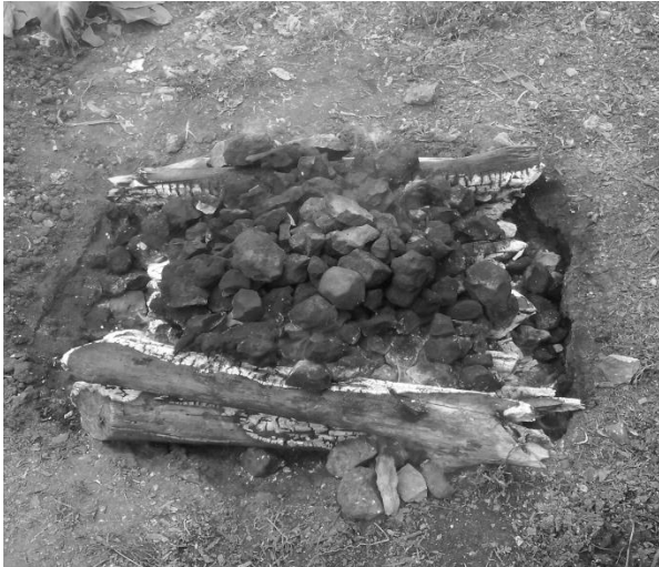
Gráfico 2 Píib- Horno Enterrado

En conjunto, la cocción del guiso se involucran técnicas de producción y tecnología de alimentos conjuntadas en el uso de hornos subterráneos, siendo la “Cochinita Pibil” (píibi’k’éek’ en lengua maya), un parte-aguas de la gastronomía regional.