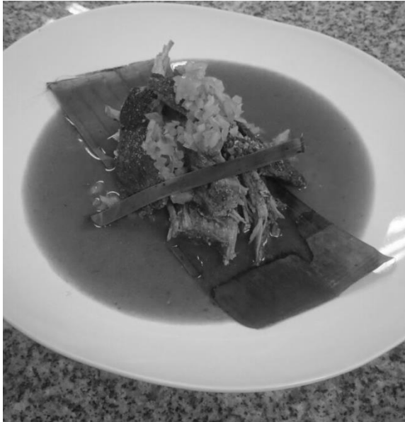
Gráfico 3 “Cochinita Pibil” estandarizada acorde a la técnica culinaria utilizada en el Poniente de Yucatán.