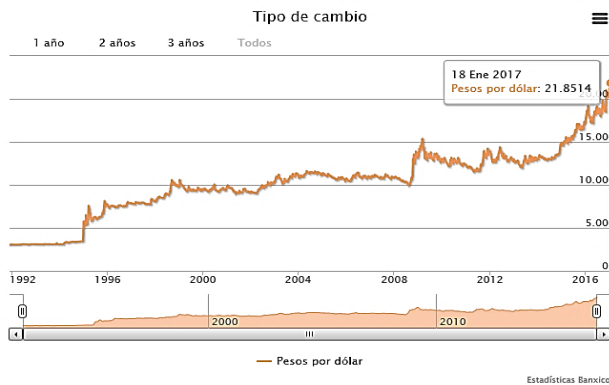
Gráfico 2 Depreciación del peso mexicano Vs. dólar americano

Obsérvese el comportamiento ascendente, con un mayor énfasis del año 2008 a la fecha, no es casualidad que coincida con el actual momento de crisis económica que se viene sopesando desde dicho año. Como se puede observar, el mismo periodo prolongado de crisis, de 8 años y continuando, ha originado que haya habido mexicanos que derivado de la contracción, estancamiento y mediocre crecimiento económico, que en muchos años ha crecido en menor tasa proporcional que el crecimiento poblacional, que la población haya quedado desempleada y le haya tocado fallecer en mismo desempleo.