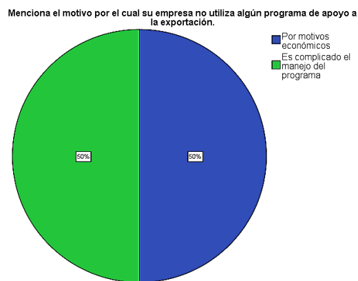
Gráfico 3 Motivos por los que la empresa no utiliza algún programa de apoyo a la exportación.