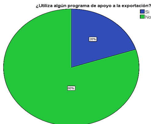
Gráfico 5 ¿Utiliza algún programa de apoyo a la exportación?

En cuanto a los resultados de manera detallada se mencionan a continuación: El 50% de las 10 empresas encuestadas no realizan actividades de exportación y el 50% que equivale a 5 empresas si exportan, de esas 5 únicamente 1 utiliza un programa de apoyo a la exportación desde hace más de cuatro años.