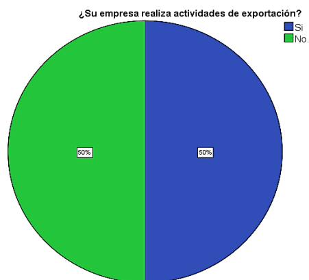
Gráfico 2 La empresa Realiza Actividades de Exportación.